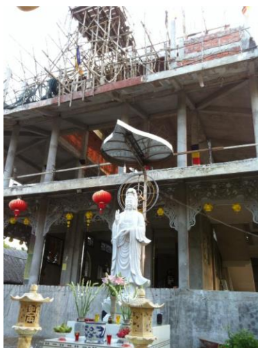
Hình: Chùa Giác Long xây đang dở

Số tài khoản: 0101697896 Ngân hàng Đông Á, chi nhánh Vĩnh Long.