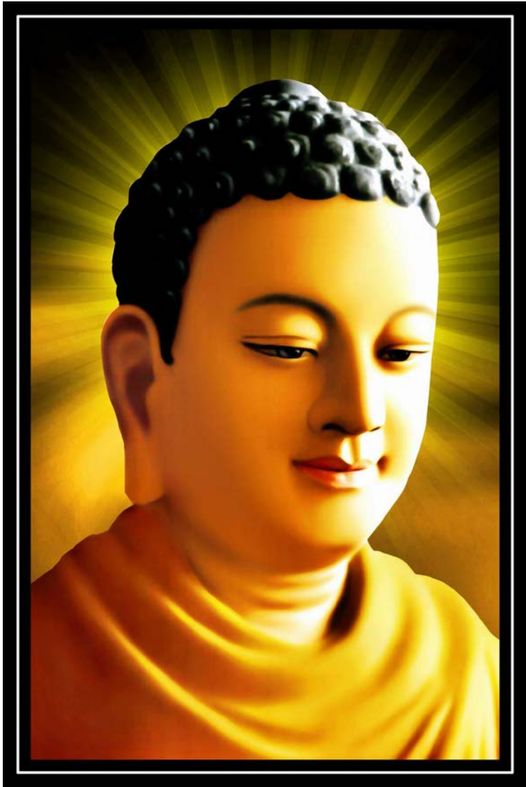
ĐỨC BỔN SƯ