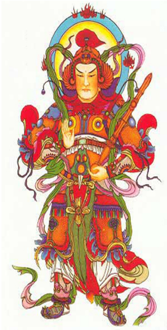
ĐỨC HỘ PHÁP