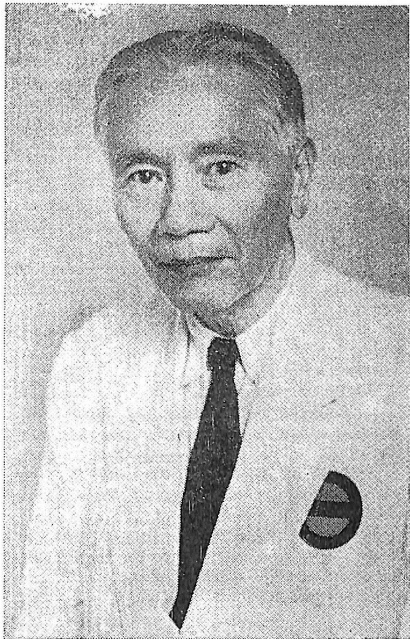
Di ảnh Cụ TRẦN TRỌNG KIM