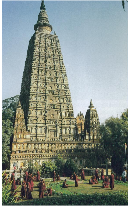
(Tháp Đại Bồ Đề trong Bồ Đề Đạo Tràng, bang Bihar, Ấn Độ Main Temple in Bodhgaya in Bihar State, India)

Theo Giáo Sư P.V. Bapat trong Hai Ngàn Năm Trăm Năm Phật Giáo, Huyền Trang cho rằng ngôi đền Bồ Đề (Bodhi) ban đầu là do vua A Dục dựng lên. Theo một trong những bia ký, sau khi lên ngôi được mười năm, vua A Dục đã đến chiêm bái nơi này mà tên gọi trong bia là Sambodhi, và rất có nhiều khả năng là nhà vua đã cho dựng lên ngôi đền trên thánh địa này. Tuy nhiên, ngày nay không thể tìm ra một dấu tích nào của ngôi đền này nữa. Ngôi đền này đã được hồi phục và tân tạo nhiều lần. Qua sự mô tả của Huyền Trang thì ngôi đền, chủ yếu là qua hình dạng và dáng vẻ bề ngoài hiện nay của nó, đã có từ thế kỷ thứ 17. Đền Đại Bồ Đề ở Miến Điện là một nguyên mẫu của ngôi đền lớn này. Theo như chúng ta thấy hiện nay thì đền Mahabodhi ở Bodh-Gaya cao gần 50 mét và gồm một thân thẳng hình kim tự tháp.