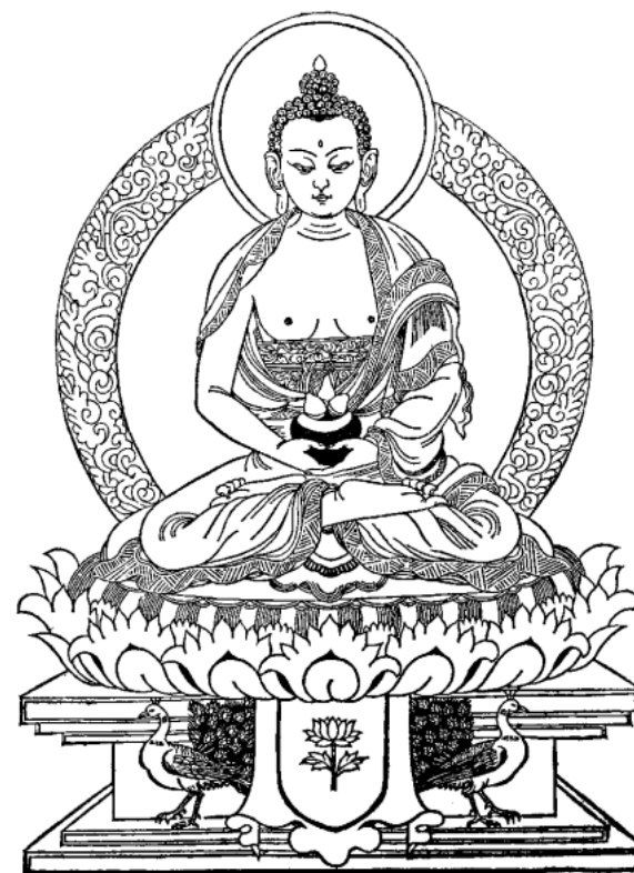
Phật A-di-đà ( Amitābha )