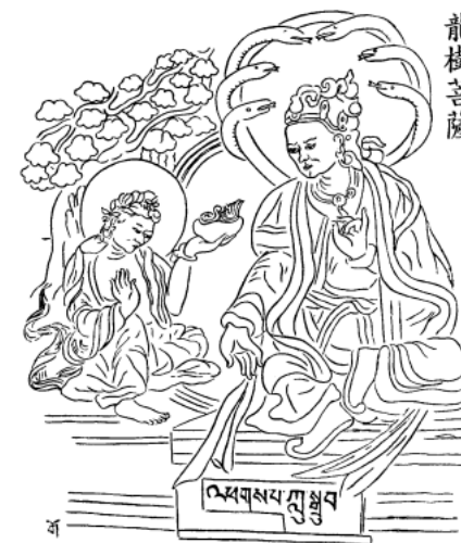
Bồ-tát Long Thọ ( Nāgārjuna )

Ngài cùng vài người bạn đồng hành từ già thành Xá-kiệt-la . Chẳng bao lâu đến một cánh rừng, gặp một bọn cướp đến năm chục người. Quân cướp lột áo, giật đồ hành lý, lại còn rượt đuổi cả nhóm đến một hồ nước. May gặp nước cạn, lại đầy bụi rậm, Ngài với mấy người đồng hành cùng kéo xuống trốn ở một chỗ kín. Bọn cướp rượt đến hồ thì mất dấu, bèn trở lại. Ngài với mấy các vị tăng cùng đi ra khỏi chỗ nấp, liền chạy vào làng mà thuật chuyện. Một người Bà-la-môn đang cày ruộng, có lẽ là chủ thôn ấy, hay tin bèn đánh mõ lên tụ tập dân làng rượt bắt bọn cướp. Nhưng chúng đã chạy mất trong rừng rồi. Mấy vị tăng mất áo và hành lý đều kêu than. Duy chỉ có Ngài Huyền Trang là tươi tỉnh, vì tâm Ngài như suối trong, nước dầu xao động, nhưng suối không đục chút nào.