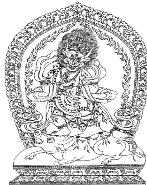
Dharmapala – Hộ Pháp luận sư

Đạt-ma-ba-la . 1 Vị này vẫn đứng đầu chùa này cho đến khi thị tịch vào năm 560. Đạt-ma-ba-la là đệ tử ngài Trần-na 2 mà ngài Trần-na chính là học đạo với hai vị Bồ-tát Vô Trước và Thế Thân. Huyền Trang may gặp được ngài Giới Hiền đúng là dòng pháp như đại thừa, được vị này truyền dạy cho pháp môn Duy thức. Về sau, nhờ đó mà Ngài soạn được bộ Thành duy thức luận 3 được xem là bộ sách cốt yếu và khái quát nhất của Duy thức tông.