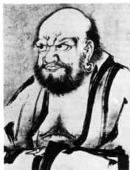
Bodhidharma, the "Barbarian from the West" (ink painting from Bokkei, 15th century)

Bức tranh Tổ Bồ-đề Đạt-ma này được vẽ từ thế kỷ 15, đề tựa là Lão Hồ phương Tây.