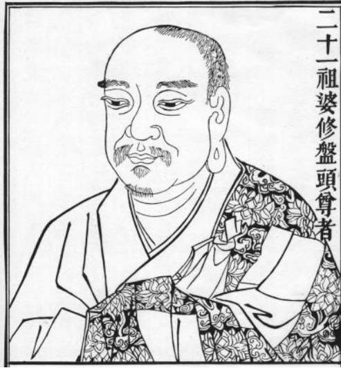
Sư Thế Thân

Có nhiều giả thuyết về con người Thế Thân, trong đó Erich Frauwallner – một nhà Phật học người Đức – cho rằng có hai người tên Thế Thân, một là luận sư của Thuyết nhất thiết hữu bộ, là người soạn A-tì-đạt-ma-câu-xá luận nổi danh của phái này. Người kia là em của Vô Trước, đã soạn bộ Duy thức nhị thập luận. Thuyết này đã bị Lê Mạnh Thát biện bác trong tác phẩm Triết học Thế Thân (The Philosophy of Vasubandhu).