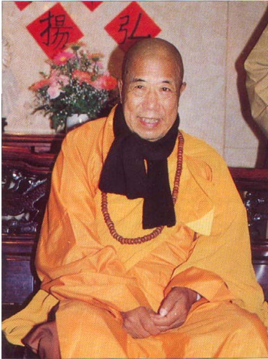
HOÀ THƯỢNG TUYÊN HOÁ