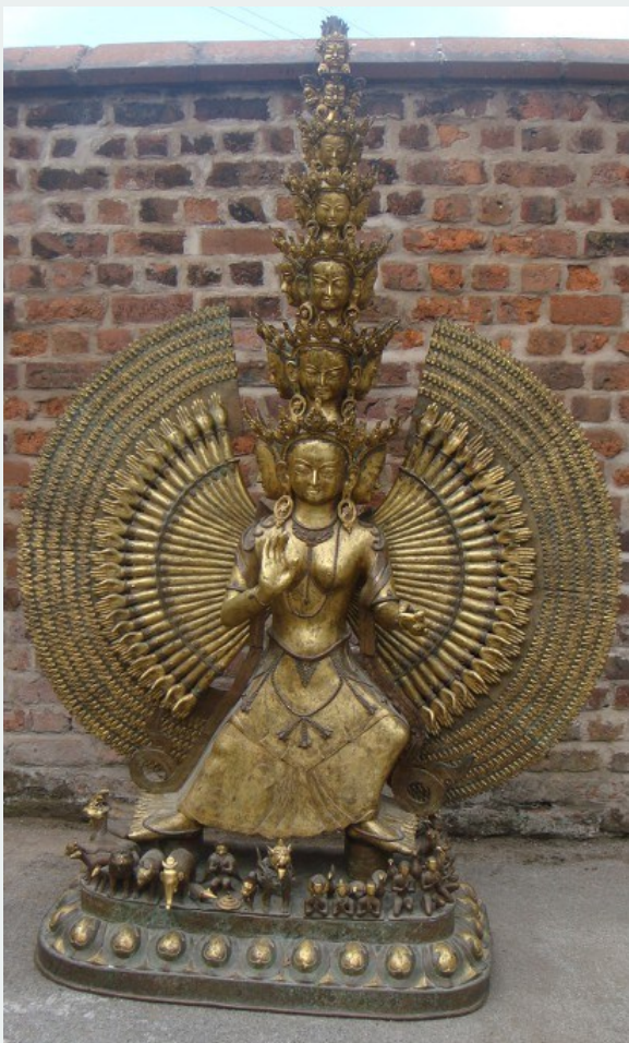
Tượng Quan Âm Bồ tát được bán đấu giá tại hạt Cheshire, Vương quốc Anh

GIÁO HỘI PHẬT GIÁO VIỆT NAM THỐNG NHẤT ÂU CHÂU La CONGRÉGATION BOUDDHIQUE VIETNAMIENNE UNIFIÉE EN EUROPE THE UNIFIED VIETNAMESE BOUDDHIST CONGREGATION IN EUROPE