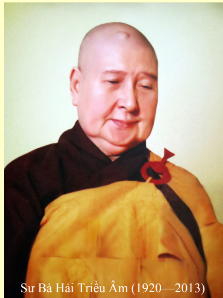
Sư Bà Hải Triều Âm (1920—2013)