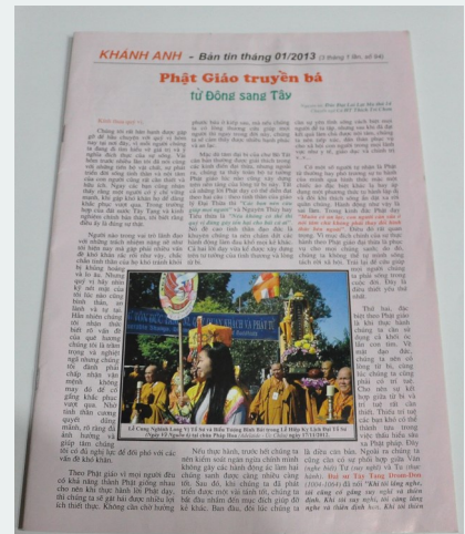
Bản tin Khánh An, tác phẩm của đời Ôn

Con có bàn thảo với TT Quảng Đạo và Ni Sư Diệu Trạng, con sẽ cùng với hai vị cố gắng sưu tập lại tất cả những bài viết của Ôn trong Bản tin Khánh An, để đăng tải đầy đủ vào trang nhà Quảng Đức và sau đó sẽ in thành một tuyển tập để lưu dấu kỷ niệm trong cuộc đời hoằng pháp của Ôn. Ngưỡng mong Ôn chứng minh và gia hộ cho chúng con làm được công việc này.