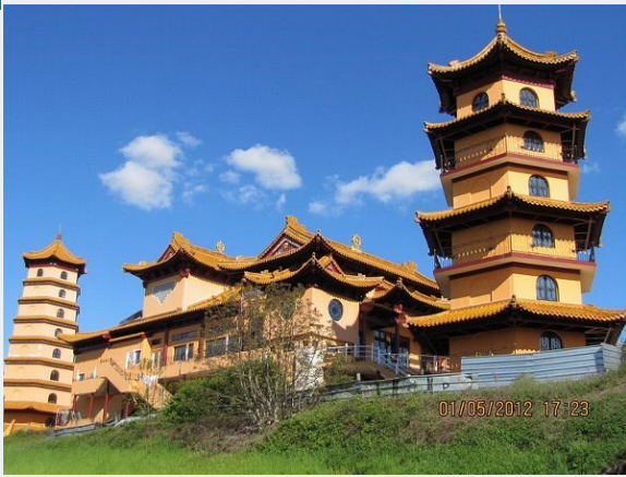
Chùa Khánh An, công trình xây dựng của đời Ôn

nguyện cầu " Nam Mô Hộ Thiên Bồ Tát", lập tức có người chuyển tiền vào ngân hàng để cứu nguy. Quả thật là Phật Pháp nhiệm mầu. Theo Ôn thì chính nhờ "kho tiền" này mà Ôn an tâm tiếp tục công việc, đó là một điểm nương tựa vững chắc cho công trình xây dựng để tiến dần từng bước, từng bước đến chỗ hoàn tất như hình ảnh chúng ta thấy hiện nay.