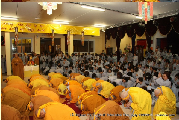
Lê Di Quan Trà Tỷ Cố HT Thích Minh Tâm, ngày 21/8/2013