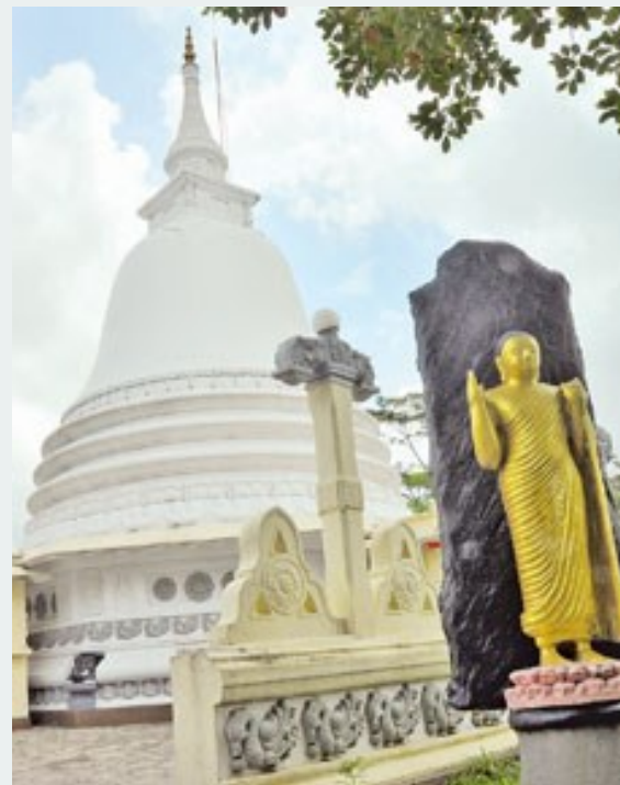
Bảo tháp tại tịnh xá Wijayarama