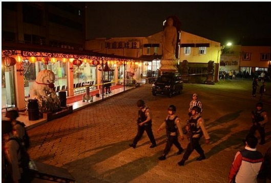
Trung tâm Phật giáo Ekayana ở Jakarta sau vụ nổ bom