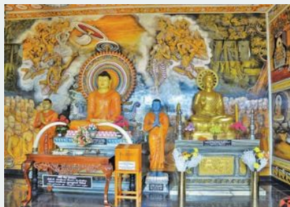
Bên trong chánh điện tịnh xá Wijayarama