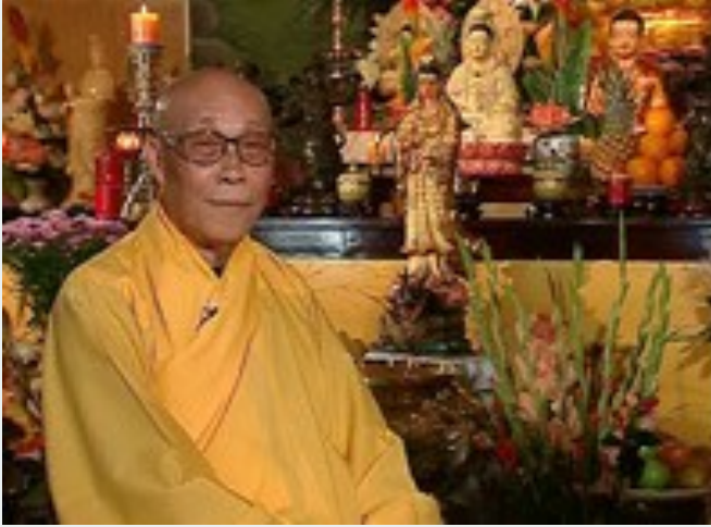
Nam Mô Bốn Sư Thích Ca Mâu Ni Phật