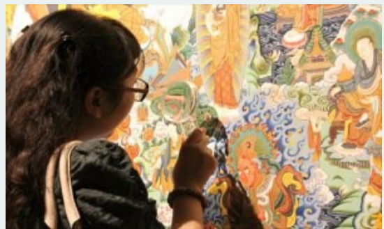
Một tranh Thangka triển lãm tại Phòng Triển lãm Nghệ thuật Hi Mã Lạp Sơn, Bắc Kinh