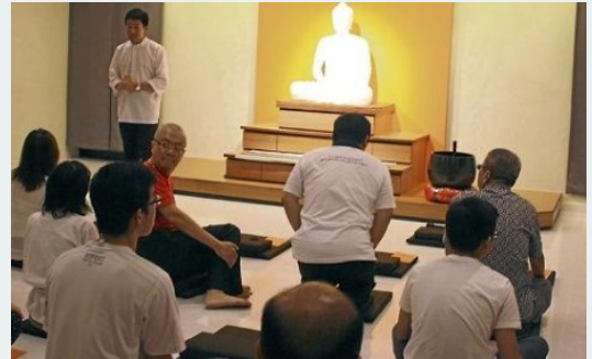
Một buổi thuyết pháp tại trung tâm Giáo dục và Tiếp cận Cộng đồng (NEO) ở Taman Johor Jaya.