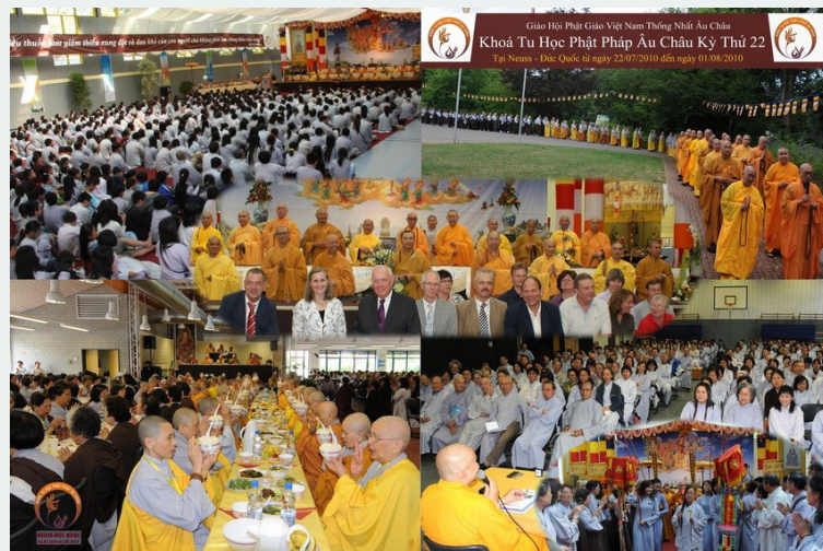
Khóa tu Âu Châu, Phật sự của đời Ôn

Đặc biệt khóa tu thứ 25 là khóa tu học cuối cùng do Ôn điều hành ( Trưởng ban tổ chức địa phương là TT Hạnh Bảo, đệ tử của HT Như Điển ), được tổ chức tại Phần Lan, và sau khóa tu bế mạc 4 ngày thì Ôn đã chọn nơi đây để đi vào cõi giới vô tung bất diệt. Ai cũng biết Phần Lan (Finland) là một quốc gia có dân cư thưa thớt nhất ở châu Âu, nên con số Phật tử lại càng ít hơn, có lẽ vì thế mà Ôn đã chọn nơi này để vào Niết Bàn với một ước nguyện Phật Pháp sẽ phát triển trong tương lai sau khi hình bóng của Ôn đã một lần xuất hiện ở nơi mảnh đất này.