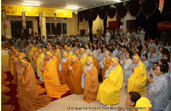
Lê Di Quan Trà Tỷ Cố HT Thích Minh Tâm, ngày 21/8/2013