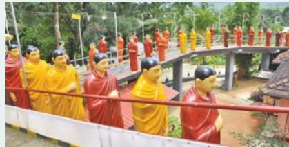
Hơn 60 tượng Tỳ kheo A La Hán trên một cây cầu tại Tịnh xá Wijayarama