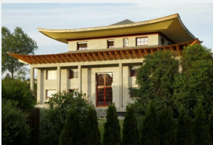
Một ngôi chùa tại Na Uy - Photo: M. Michael Brady

Và Phật giáo cũng được du nhập vào Na Uy bởi dân nhập cư và tị nạn từ các nước có dân số Phật giáo lớn là Việt Nam, Thái Lan, Miến Điện, Cam Bốt và Tích Lan. Ngày nay, 85% trong số hơn 10.000 Phật tử đã đăng ký tại Na Uy là người nhập cư thể hệ thứ nhất hoặc thứ hai đến từ 5 nước này.