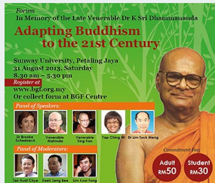
Poster của Diễn đàn "Thích ứng Phật giáo với thế kỷ 21"