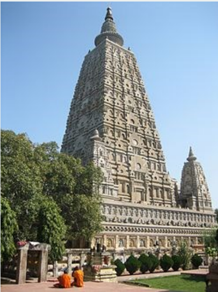
Chùa Đại Bồ đề