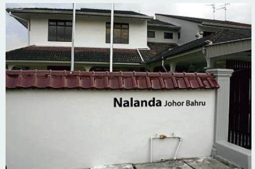
Trung tâm NEO