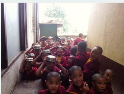
Các tiểu ni tại ni viện Tsoknyi Gechak Ling, Nepal