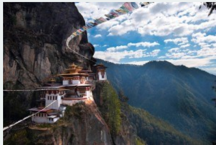
Tu viện khổ hạnh Hang Hồ ở Bhutan, một trong nhiều địa điểm quyền năng có liên quan đến đại sư Padmasambhava