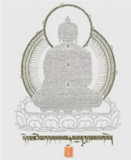
Tranh của Jamyang Dorjee (2010)