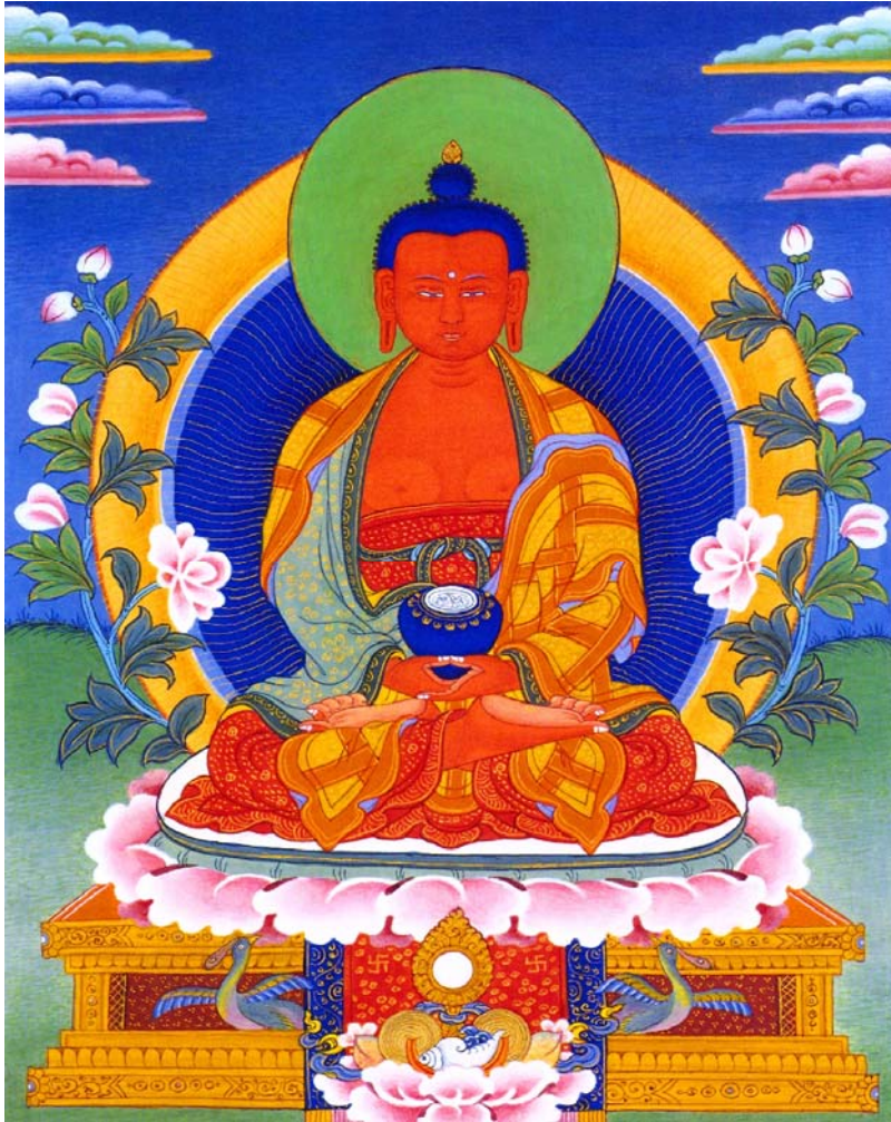
Hình 12: Đức Phật A Di Đà (Amitabha, the Budha of Infinite Light)

Bây giờ chúng ta sang chương thứ 7 để khảo sát về Đức Phật này và cảnh giới Cực Lạc của Ngài như là