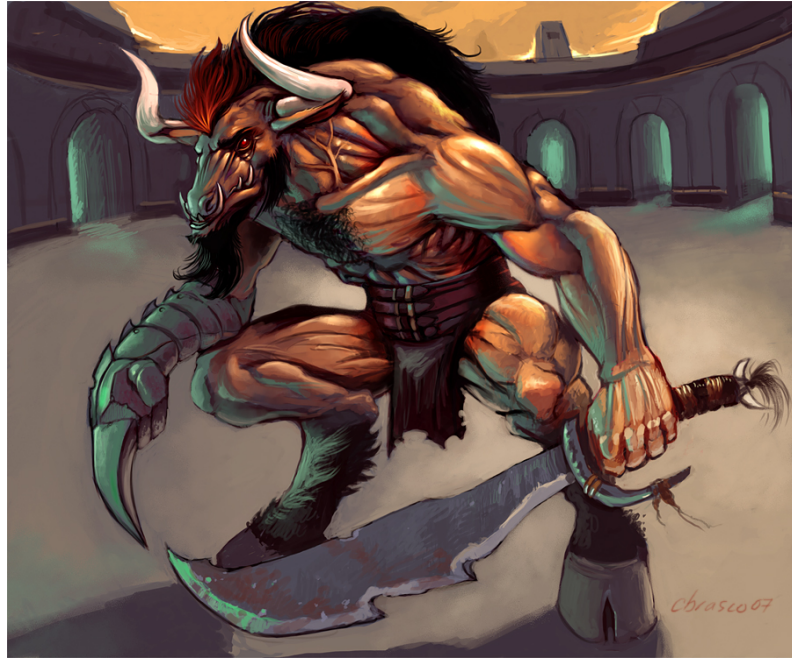
Hình 5: Thần Chết có thân người đầu bò

Đức Tara Trắng nói với Karma, “Ở bên ngoài vị ngôi giữa là Pháp Vương nhưng ở bên trong là Guru Rinpoche. Ở bên ngoài, vị đứng bên phải Guru Rinpoche đang nhìn chúng ta với đôi mắt lồi và la hét như sấm, “HUNG! HUNG! PHAT! PHAT!” là một Thần Chết, bên trong Ngài là hình dạng phân nộ của Ngài Văn