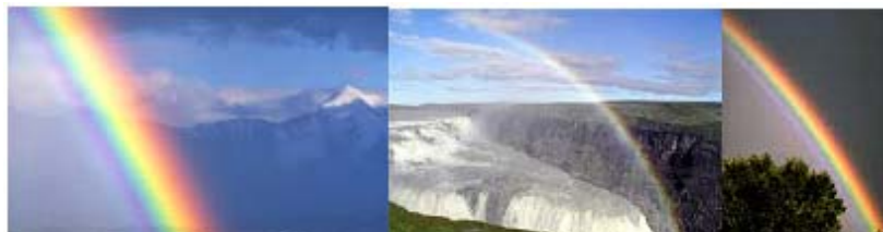
Hình 7: Ánh sáng cầu vồng