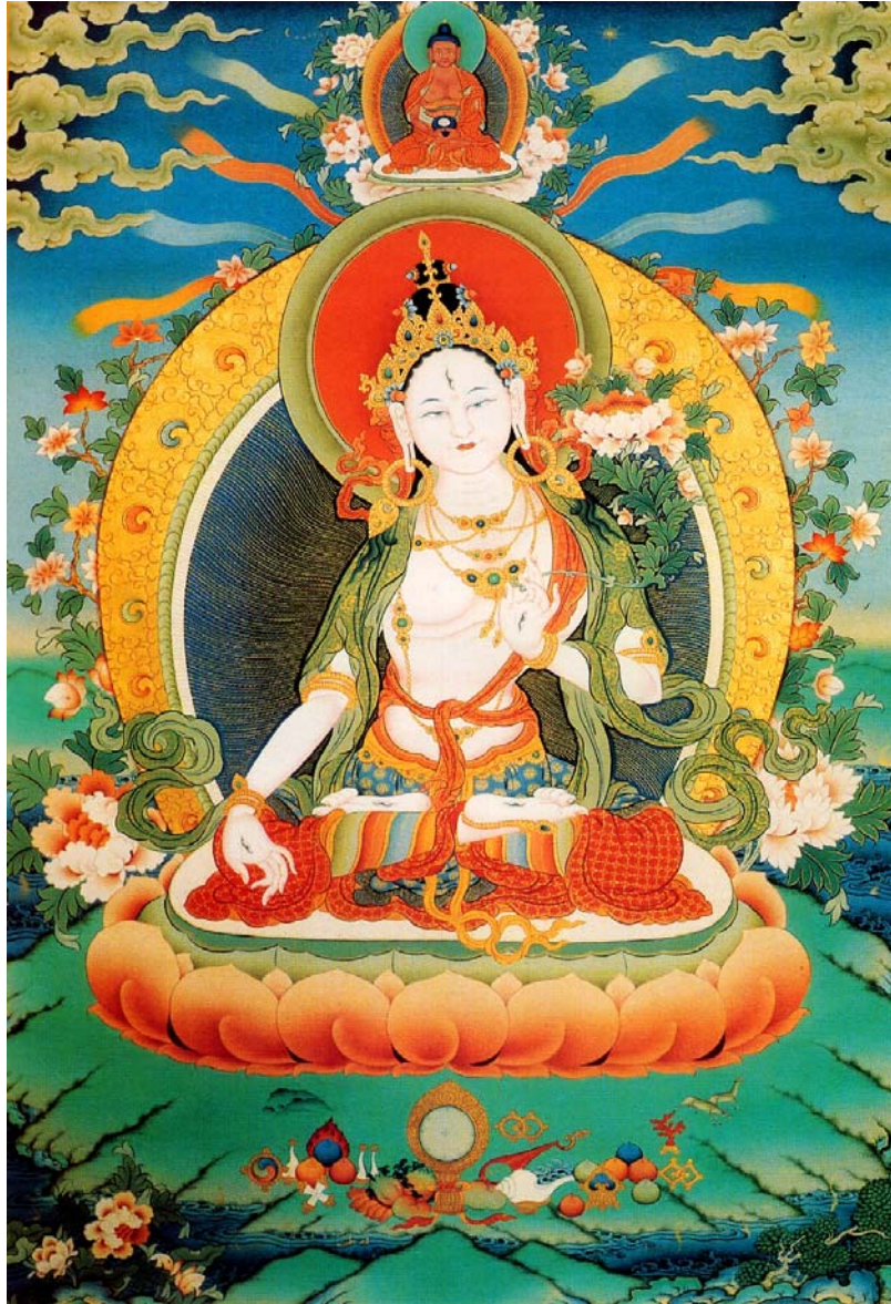
Hình 4: Đức Tara Trắng