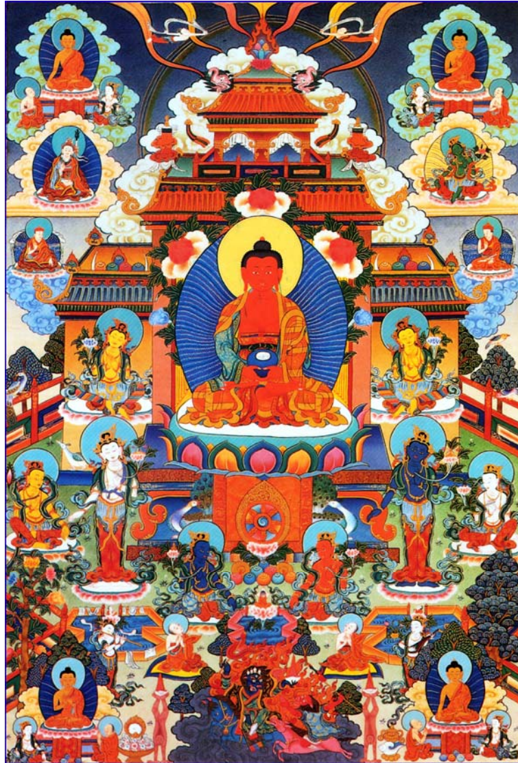
Hình 13: Đức Phật A Di Đà và thế giới Cực Lạc