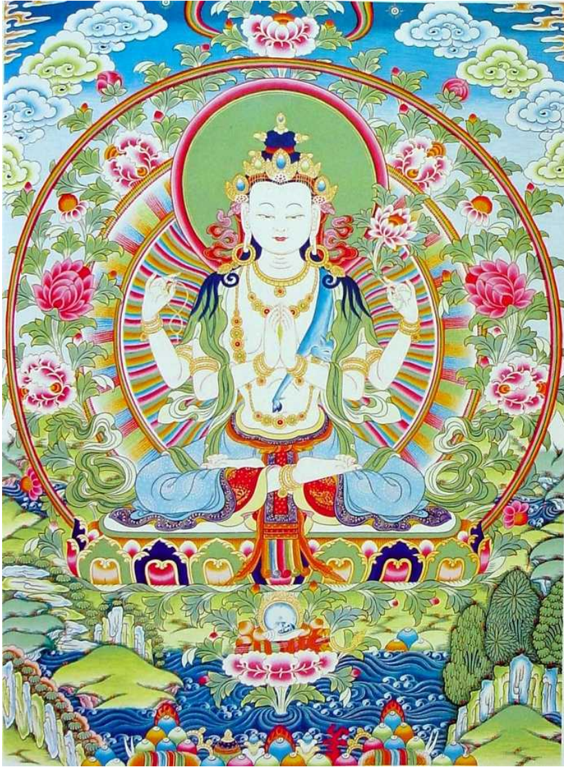
Hình 14: Bồ Tát Quán Thế Âm (Avalokitesvara)