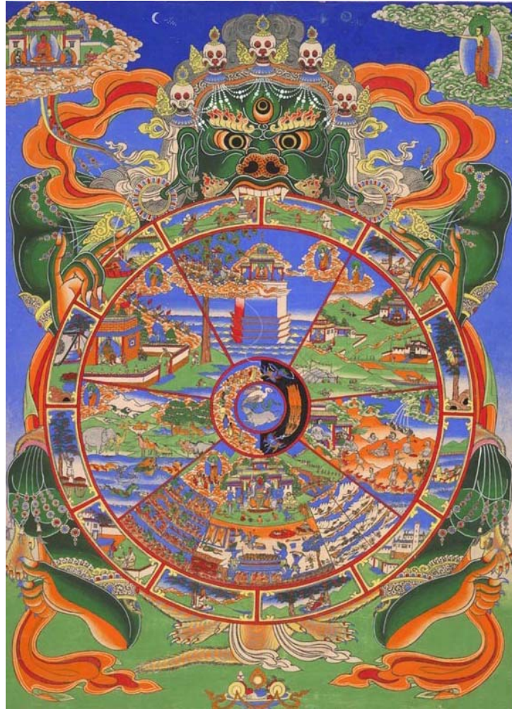
Hình 11: Vòng luân hồi theo Phật Giáo Tây Tạng