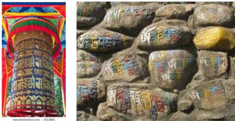
Hình 6: Thân chủ Lục Tự được khắc trên bánh xe cầu nguyện và trên đá ở Tây Tạng

phụng sự Tam Bảo, để giúp tôi giải trừ những đau khổ ở địa ngục, không có Thân chủ nào linh nghiệm như là Lục Tự Đại Minh Chơn ngôn: OM MANI PADME HUNG . Vì vậy, xin hãy trì niệm hay thỉnh cầu người khác cùng trì niệm thân chủ này mười ngàn biến. Xin khắc thân chủ này trên đá và chồng lên nhau thành một đống. In thân chủ này lên trên vải và treo chúng như cờ phướn. In thân chủ này lên giấy, và quay chúng như những bánh xe cầu nguyện.”