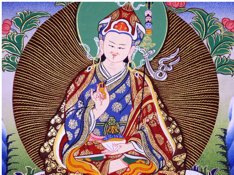
Hình 8: Đức Liên Hoa Sanh