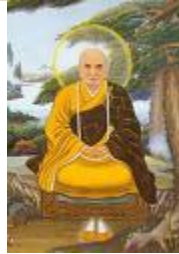
Ấn Quang Pháp Sư