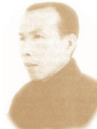
HT Thiên Tâm Dịch