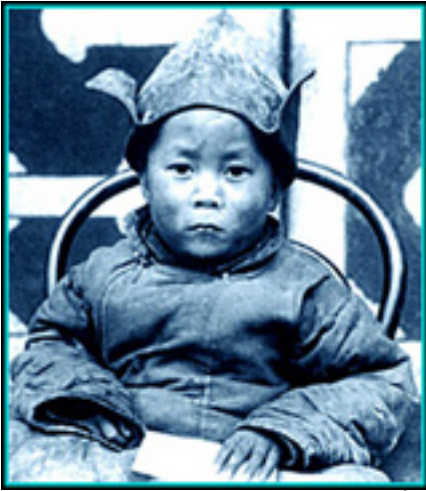
Đức Đạt Lai Lạt Ma, năm 2 tuổi

tôi. Ngay trong ngày ngài ra đời, tôi đã bảo hộ ngài” (somebody like you who is upholding the Buddhist teaching needs a protector like me. Right on the day of your birth, I helped you). Như vậy chúng ta thấy rõ ràng có sự liên quan giữa Mahakala, những con quạ và các vị Đạt Lai Lạt Ma.