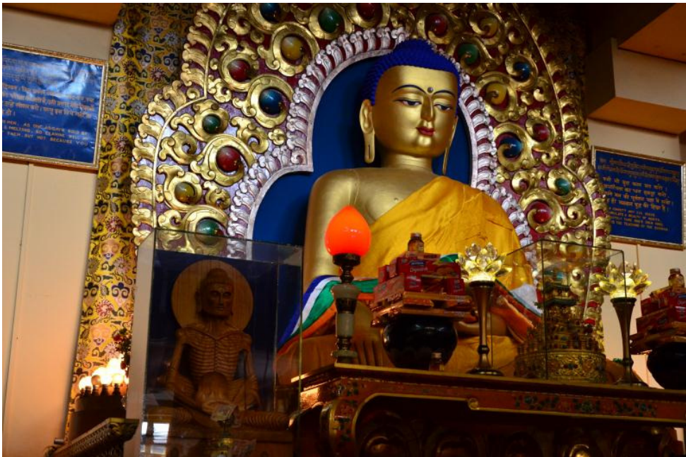
Tượng Đức Phật Thích Ca Mâu Ni tại chùa Tây Tạng ở Dharamsala, Ấn Độ

Tyranny - sự bạo ngược, sự chuyên chế (Tyrant - bạo chúa)