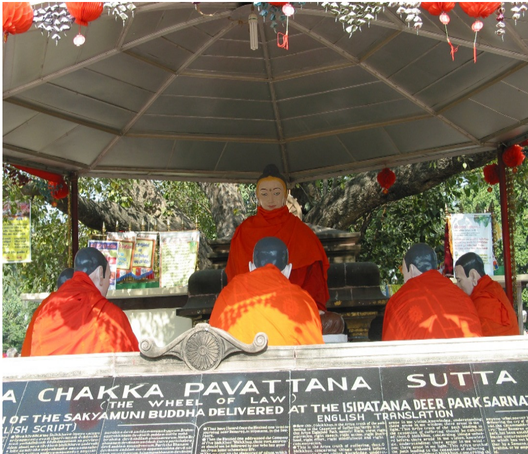
Tượng năm Thầy Kiều Trần Như tại Vườn Nai (Sarnath), Ấn Độ