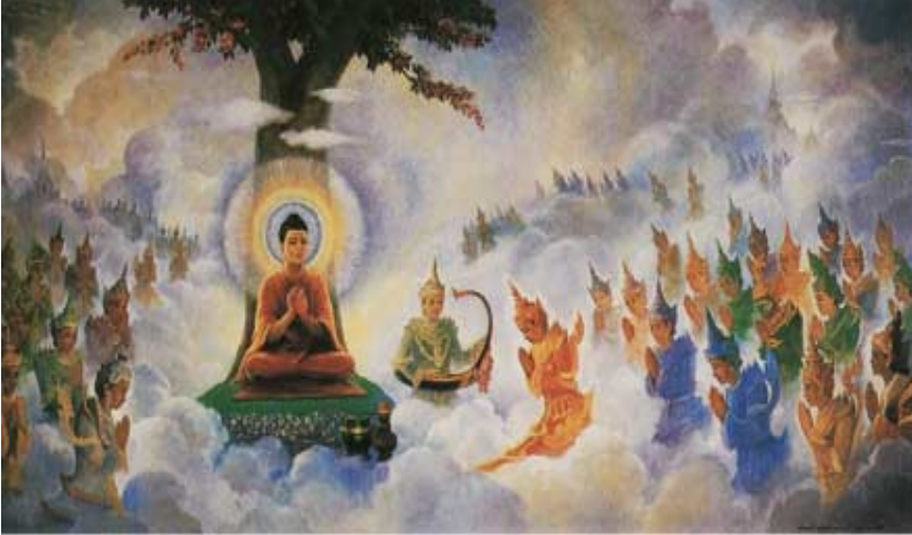
Cung Trời Đao Lợi / Đâu Suất

“Đức Phật là đạo sư của tam giới, là từ phụ của tứ sinh...” . Tứ sinh là thai sinh, noãn sinh, thấp sinh và hóa sinh, còn Tam giới là những gì?