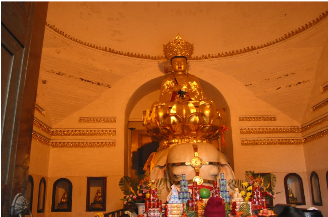
Tượng Ngài Phổ Hiền Bồ Tát