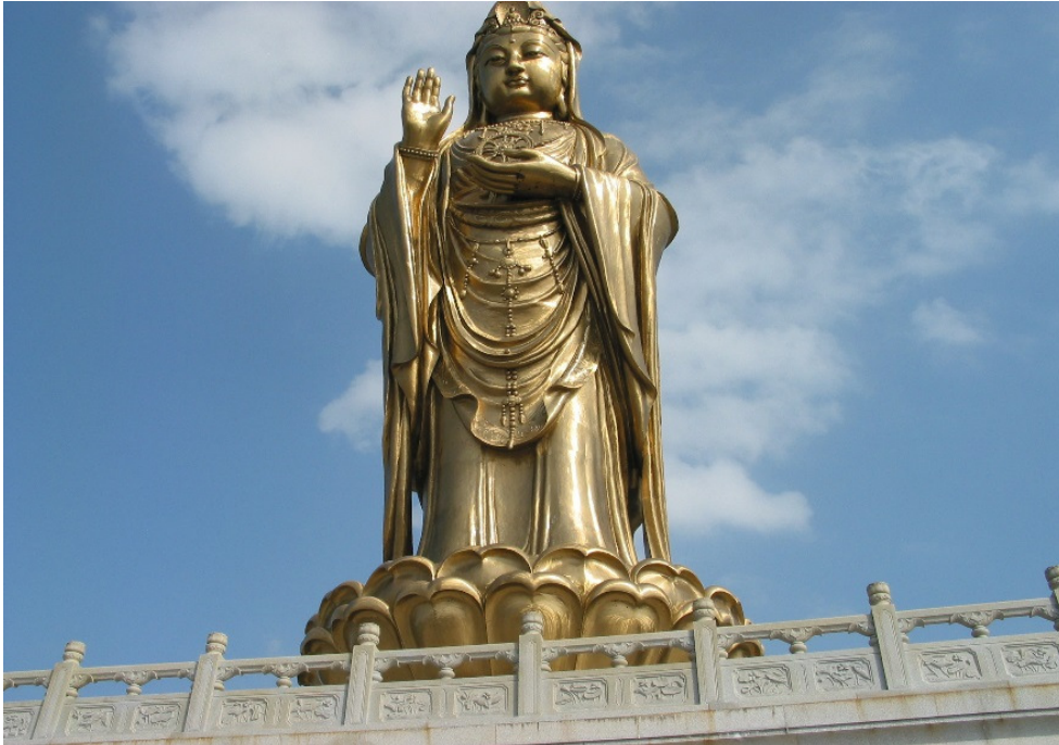
Tượng Quán Thế Âm tại Phổ Đà Sơn, Trung Quốc

“NAM MÔ ĐẠI TỪ ĐẠI BI TÂM THANH CỨU KHỔ CỨU NẠN QUAN THẾ ÂM BỒ TÁT MA-HA-TÁT”