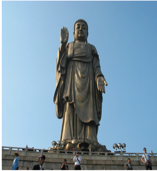
Tượng Phật A-Di-Đà cao 88 m - Linh Sơn Đại Phật - Vô Tích, Trung Quốc

có chỗ quy hướng là cõi Tây phương Cực Lạc của Phật A Di Đà. Sinh về đó rồi tiếp tục tu hành, không mất một giọt lành, chờ ngày tu hành thành Phật..