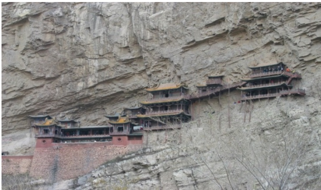
Chùa treo tại Thái Nguyên, Trung Quốc

Wu-hsing (Ngũ Đại)– five phases known as five Elements or Agents. Articulate (nôi khớp) Ch'i as greater or lesser YIN (Water and Metal), greater or lesser YANG (Fire and Wood) and a balanced center (Earth). These phases are related through patterns that are mutually engendering (Wood-Fire-Earth-Metal-Water) and mutually destructive (Fire-Water-Earth-Wood-Metal)