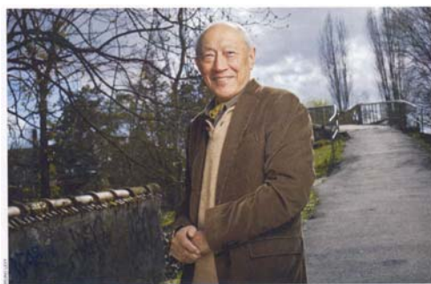
Ngài Dagpo Rimpoché

http://www.quangduc.com/tacgia/hoangphong.html