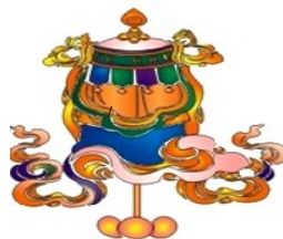
(Bát Cát Tường: Bảo Cái, Dhvaja)

5. Giờ đây... sự thành tựu đang đến..! Một lần nữa, (Cô/bác...) hãy hướng tâm vào bên trong, dứt bật mọi vọng niệm - chân thành tha thiết niệm Phật - tinh tấn chuyển biến tập khí. Chuyển điều ác thành điều thiện - chuyển mê thành ngộ - chuyển phàm thành thánh... thì trời Tây mở lối đường quang đảng - tràng phan thiên nhạc đón rước chúng ta trở về, ( dự vào chín phẩm sen vàng nơi ) Tây Phương Tịnh Độ. Nam mô A Di Đà Phật.