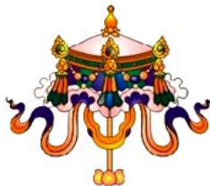
(Bát Cát Tường: Tôn Thắng Tràng, Chattra)

Trên đây là những mức chúng tôi đưa ra, quý vị có thể nhìn vào bản “Thẩm Định” mà tự xét lấy mình. Nếu đã quyết lòng về Tây Phương thì đừng nên ỷ lại bất cứ điều gì. Thấy người mê man bất tỉnh trong bệnh viện, đừng nghĩ rằng mình không đến nỗi như vậy. Nghiệp chương ai cũng có, bây giờ nó chưa đủ duyên trở ra thôi, khi trở ra thì coi chừng nặng hơn người khác mà không hay! Mong chư vị nghĩ đến huệ mạng ngàn đời ngàn kiếp mà cố gắng tinh tấn tu hành. Nam Mô A Di Đà Phật.