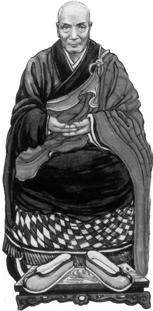
Đức tướng An Quang Đại Sư Liên Tông Tổ thứ 13