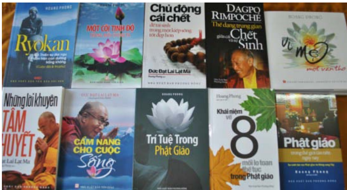
Những đầu sách và CD Phật giáo của dịch giả Hoang Phong gửi tặng TVHS