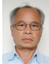
Hoang Phong biên dịch