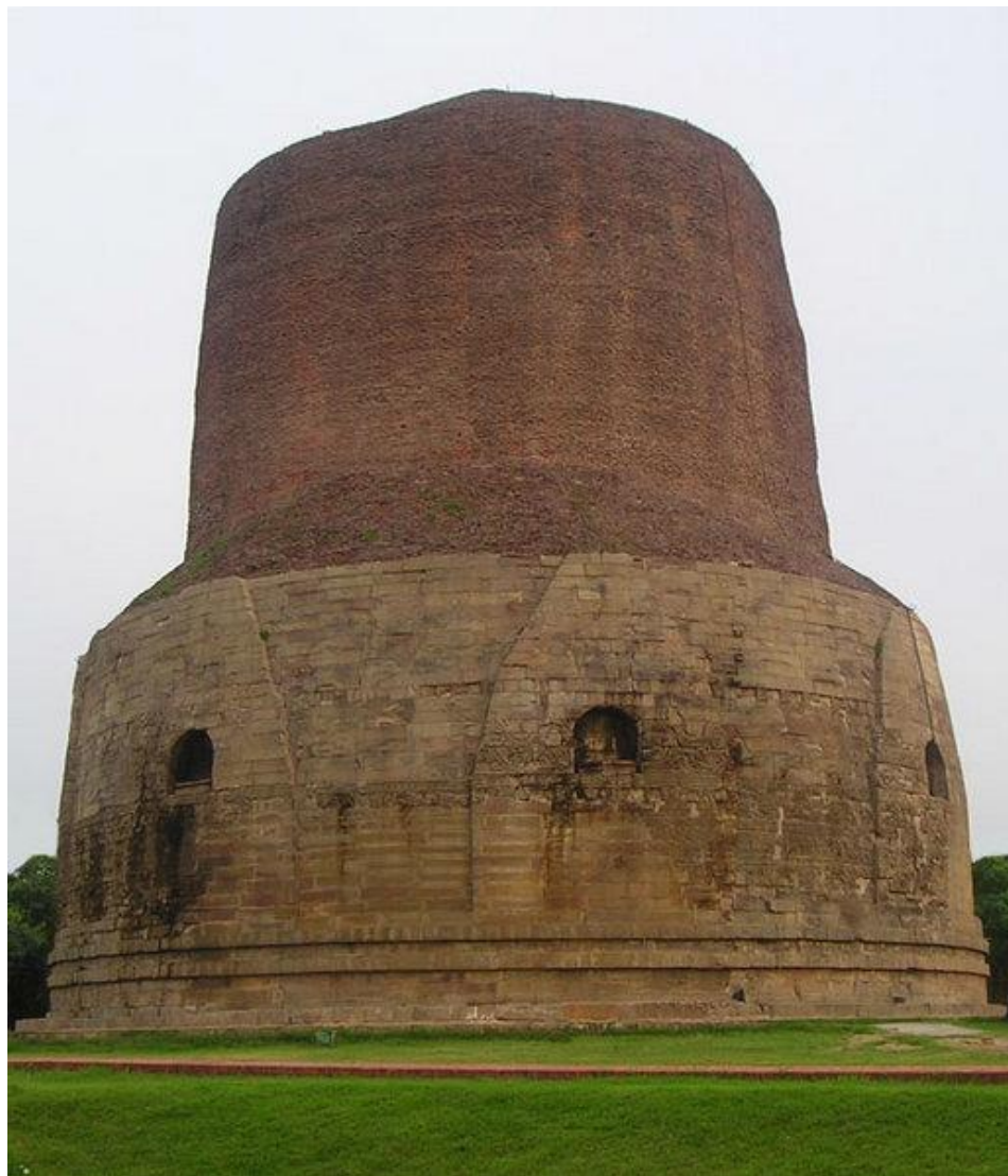
Tháp Dhamekh di tích được xây rất sớm (thế kỉ 6 TCN) cao 150 bộ bằng gạch nung

Bồ Đề đạo tràng (BodhiGaya). Đây là nơi mà Thích Ca đã ngồi thiền và thành đạo. Alexander Cunningham và các cộng sự đã tìm ra các chứng tích về các cột trụ của đạo tràng này vào thập niên 1880. Tháp Bồ Đề ngày nay được dựng lại từ thế kỉ thứ 7. BodhiGaya cách thành phố Gaya 12 km bằng đường bộ. Người ta có thể đến đó qua ngã Gaya bằng đường hàng không hay dùng xe lửa Delhi-Calcuta.