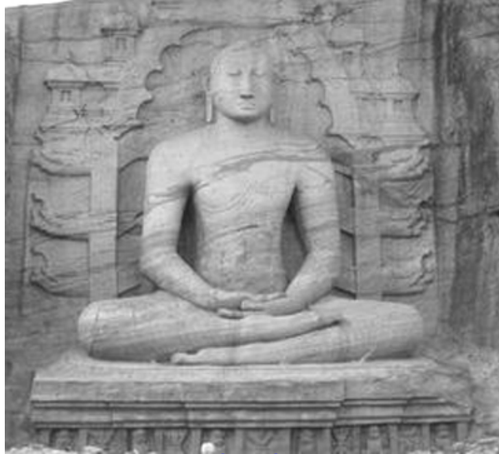
Tượng Phật ngồi thiền Lord Buddha được tạc vào thế kỉ thứ 12 cao 14 mét ở Sri Lanka

Anuradhapura, cách Colombo 250 km về phía bắc. Từ Colombo có nhiều chuyến xe buýt Colombo-Anuradhapura mỗi ngày. Phương tiện tàu hoả từ Colombo đến Anuradhapura cũng có.