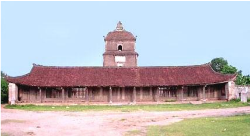
Chùa Dâu tỉnh Bắc Ninh xây khoảng thế kỉ thứ 3, tại trung tâm Phật giáo Luy Lâu Việt Nam

Có nhiều bằng chứng cho thấy Phật giáo du nhập vào Việt Nam vào thế kỉ thứ 1, sớm hơn cả Trung Hoa. Tuy nhiên, Việt Nam cũng như các nước lân bang khó tránh khỏi nhiều ảnh hưởng về văn hoá và truyền thống tôn giáo của Trung Hoa. Việt Nam đã trải qua rất nhiều cuộc chiến tranh với ngoại bang và những lần nội chiến đã có hệ quả tất yếu là hầu hết các công trình kiến trúc đặc sắc nói chung và Phật giáo nói riêng bị huỷ hoại phần lớn. Chưa kể ngay cả trong thời bình các phù điêu tượng khắc hay nghệ thuật cổ Phật giáo Việt Nam cũng đã bị thất thoát ra nước ngoài. Hiện tại các vùng còn lại những di chỉ quan trọng là: