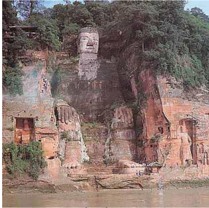
Tượng Phật lớn nhất thế giới cao 71m được tạc trong núi đá từ 713, công trình mất 90 năm mới xong

Phật giáo phát triển rất sớm ở Trung Hoa. Do địa bàn rộng lớn nên có nhiều di tích liên quan đến lịch sử Phật giáo. Đáng kể là: