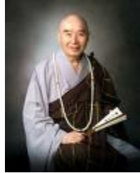
Pháp Sư Tịnh Không