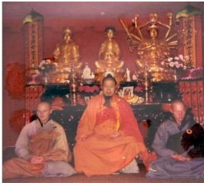
HT Tuyên Hóa và hai đệ tử người Mỹ ( xem bài về hai vị này ở đây )

Vào năm 11 tuổi, trong một lần băng qua một cánh đồng gần ngôi làng, ngài thấy một tử thi của một đứa trẻ nằm dưới đồng rơm. Ngài chưa từng thấy người chết trước đó, nên hỏi mẹ ngài và mới biết đó là cái chết, cái sự hủy hoại của một kiếp người. Trong tâm trí non nớt bất giác ngài suy nghĩ có cách nào để thoát khỏi sự chết chăng ? và ngài được một người quen khuyên rằng "chỉ có một con đường duy nhất để thoát chết là tu tập theo con đường Đạo để giác ngộ được bản tâm và biết rõ được bản lai diện mục của mình" (The only way to escape death is to practice the Tao/Way so as to enlighten one's mind and understand one's inner self). Do đó ngài muốn xuất gia đầu Phật để có thể thực hành được con đường đạo trọn vẹn.