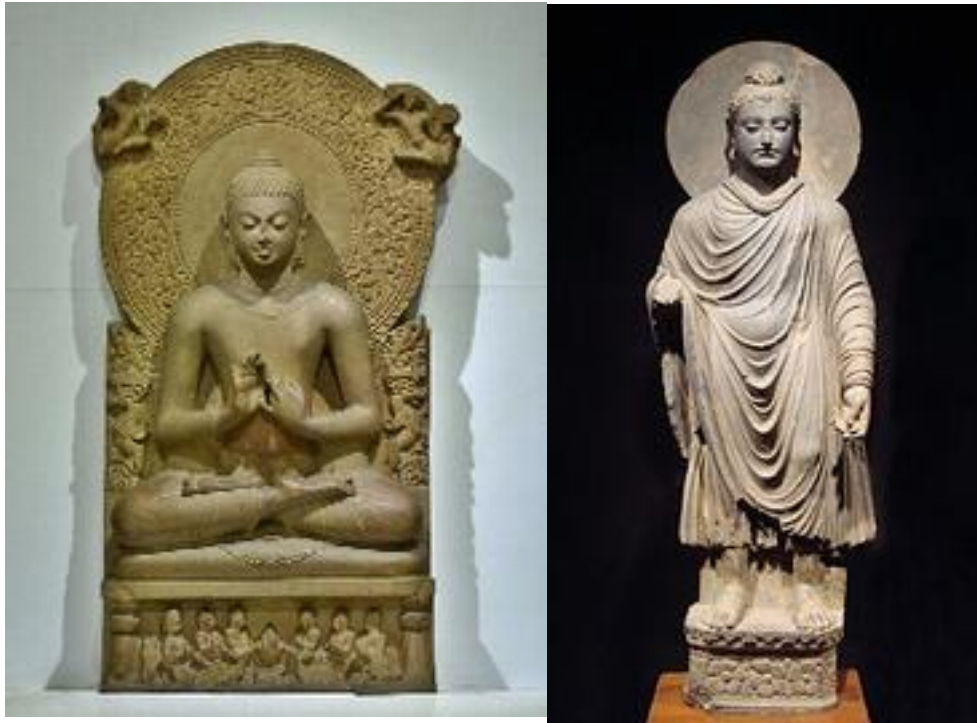
Buddha in Sarnath Museum (Dharmajak Mutra), 4 th BC