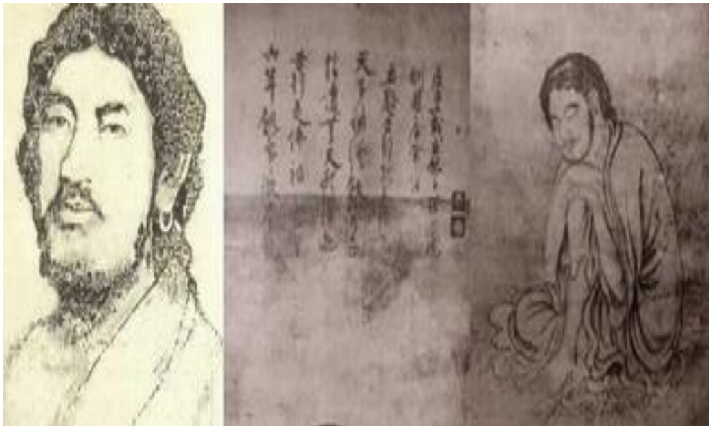
The Buddha, in Greco-Buddhist style, 1st-2nd century CE, Gandhara (Modern Pakistan), Standing Buddha (Tokyo National Museum)