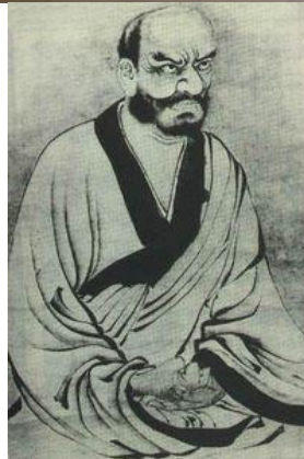
Thiền Sư Lâm Tế