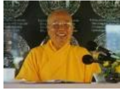
Hòa Thượng Thanh Từ Dịch