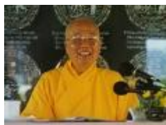
HT Thanh Từ Dịch