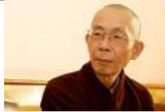
HT. Chơn Thiện Sài Gòn, 2000