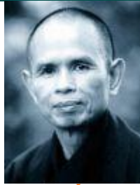
HT. Nhất Hạnh