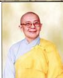
NS Trí Hải