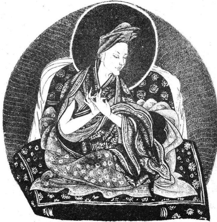
LOSSAN CHHO KYI GYAL—TSHAN