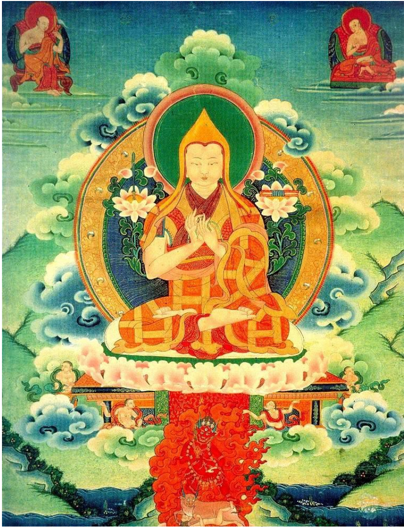
Tsongkhapa Losangdrakpa (1357 - 1419) – རྗེ་ཙོང་ཁ་པ་སློབ་བཟང་གྲགས་པ