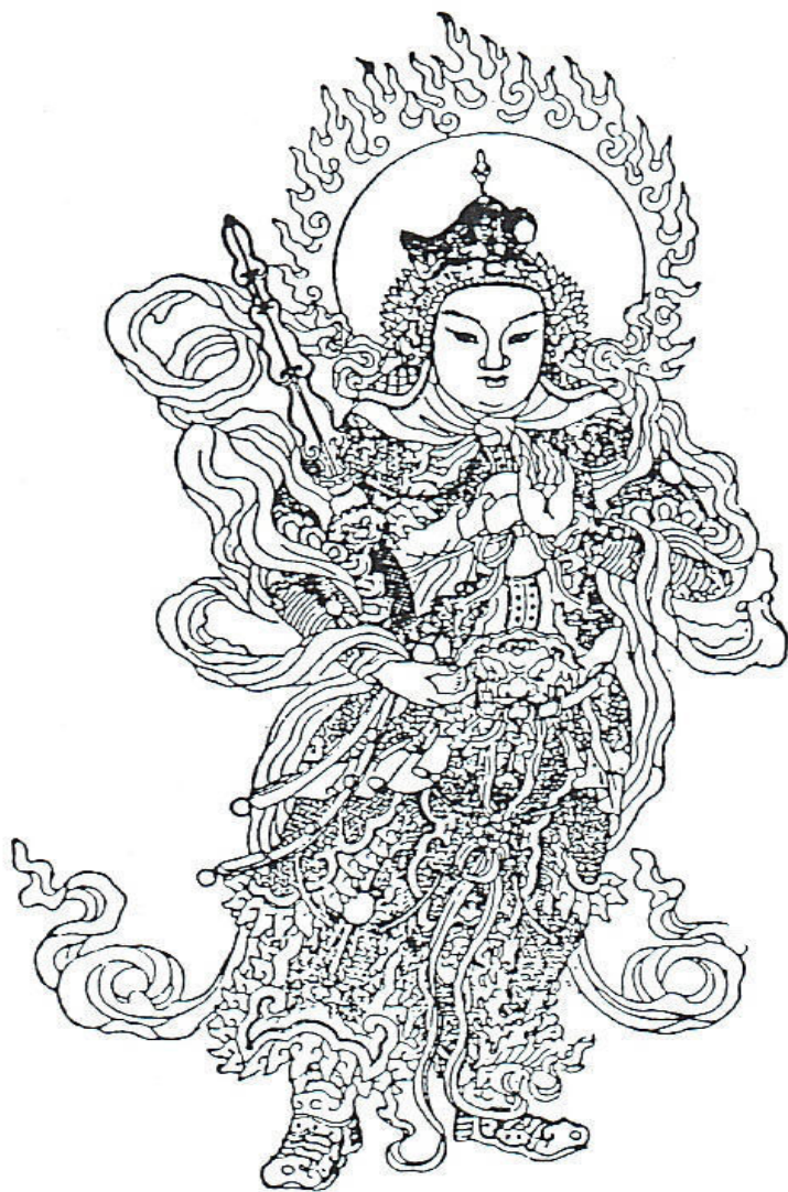
Tượng Vệ Đà, tranh Phật. Căn đại.