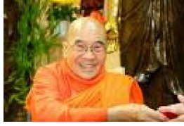
HT. Tâm Châu Dịch