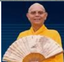
Pháp Sư Từ Thông