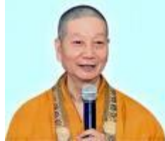
HT. Trí Quảng