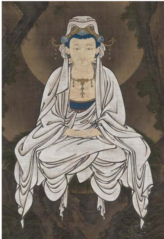
Tượng Quán Thế Âm nam giới có râu mép.

Theo khảo cứu của họa giả Edkins thì người Trung Hoa thờ phụng đức Quán Thế Âm sớm nhất vào khoảng thế kỷ thứ nhất cho đến năm 220 sau công nguyên. Nhưng theo sự nghiên cứu của học giả Alice Getty thì việc thờ phụng đức Quán Thế Âm được truyền bá vào Trung Hoa vào cuối thế kỷ thứ nhất sau công nguyên và lúc đó gọi là Quán Âm. Có một lý luận cho rằng vua nhà Đường tên là Lý Thế Dân cho nên nhà vua cho đổi Quán Thế Âm thành ra Quán Âm vì chữ “Thế” là húy kỵ của nhà vua. Ở trong các hang động Long Môn (Lung men) và Vân Cương (Ying kang) , các nhà khảo cổ tìm thấy hình tượng đức Phật Thích Ca và các vị Bồ Tát được tạc và điêu khắc trong hình tượng nam giới vào thời kỳ ban sơ tức là vào khoảng thế kỷ thứ tư và thứ năm sau công nguyên. Và tất cả những tranh tượng điêu khắc đó đều mang đặc tính nghệ thuật Trung Hoa. Ngay cả đến thế kỷ thứ mười, Quán Thế Âm còn được giữ dưới dạng nam giới trong các động ở Đôn Hoàng (vùng Tân Cương) và tượng Quán Thế Âm có để râu mép.