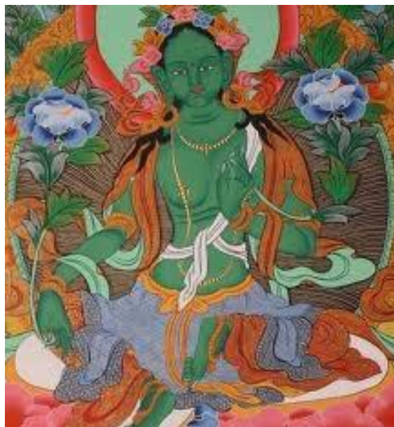
Quán Thế Âm Tây Tạng

Hiện nay, có pho tượng của Bồ Tát Quán Thế Âm Thiên Thủ Thiên Nhân được thực hiện vào thời nhà Mạc (thế kỷ thứ 16) vẫn còn lưu lại ở Viện Bảo Tàng Mỹ Thuật tại Hà Nội và pho tượng này đã được dùng làm tợng mẫu để điêu khắc những pho tượng lớn nhỏ khác.