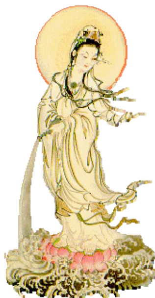
Quán Thế Âm Trung Hoa