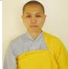
NS Giới Hương