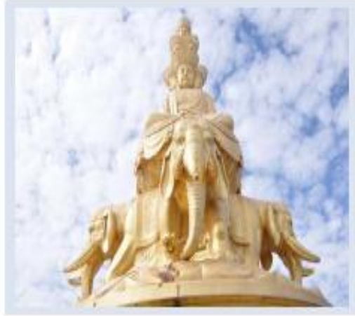
NAM MÔ ĐẠI HẠNH PHỔ HIỀN BỒ TÁT