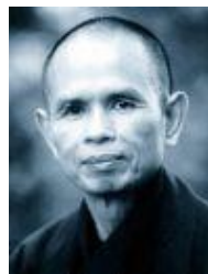
HT Nhất Hạnh