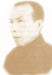
HT Thiền Tâm Dịch