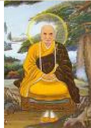
Ấn Quang Pháp Sư