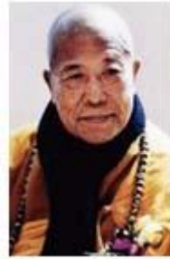
HT Tuyên Hóa