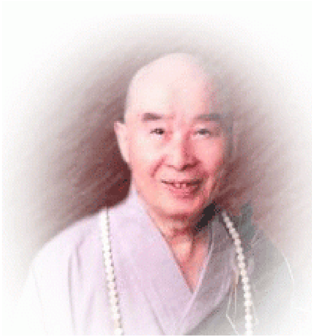
PHÁP SƯ TỊNH KHÔNG