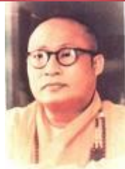
HT Thiện Hoa