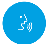
음성 인식 문서 작성