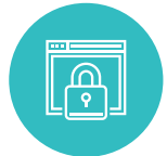
악성 코드 차단

(*문서진본확인 서비스는 B2B, B2G 제공 기능으로 별도 커스터마이징이 필요합니다.)