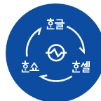
프로그램 간 작업 호환