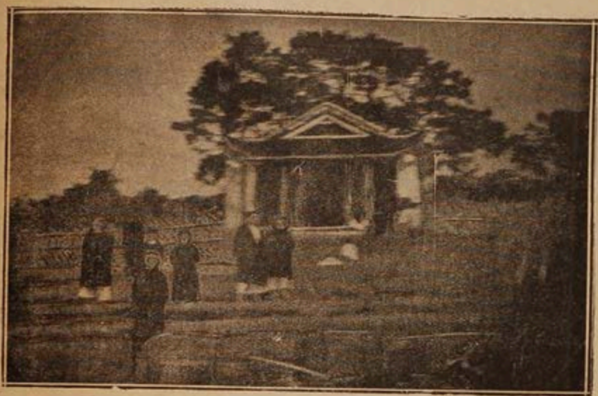
Chùa Bi Thượng