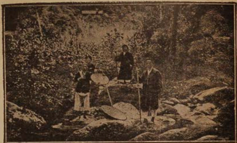
Suối Giải-oan (ngọn chùa cao ở đằng sau là chùa Giải-oan)