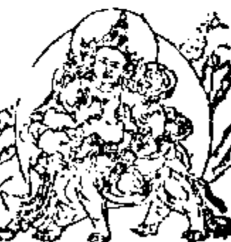
वज्रहस्तस्यै नमः 帝釋天