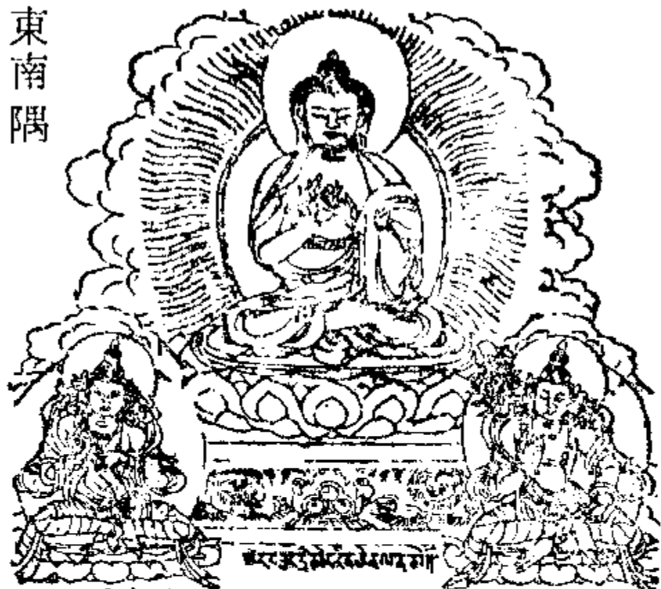
वज्रहस्तस्यै नमः 金剛手菩薩