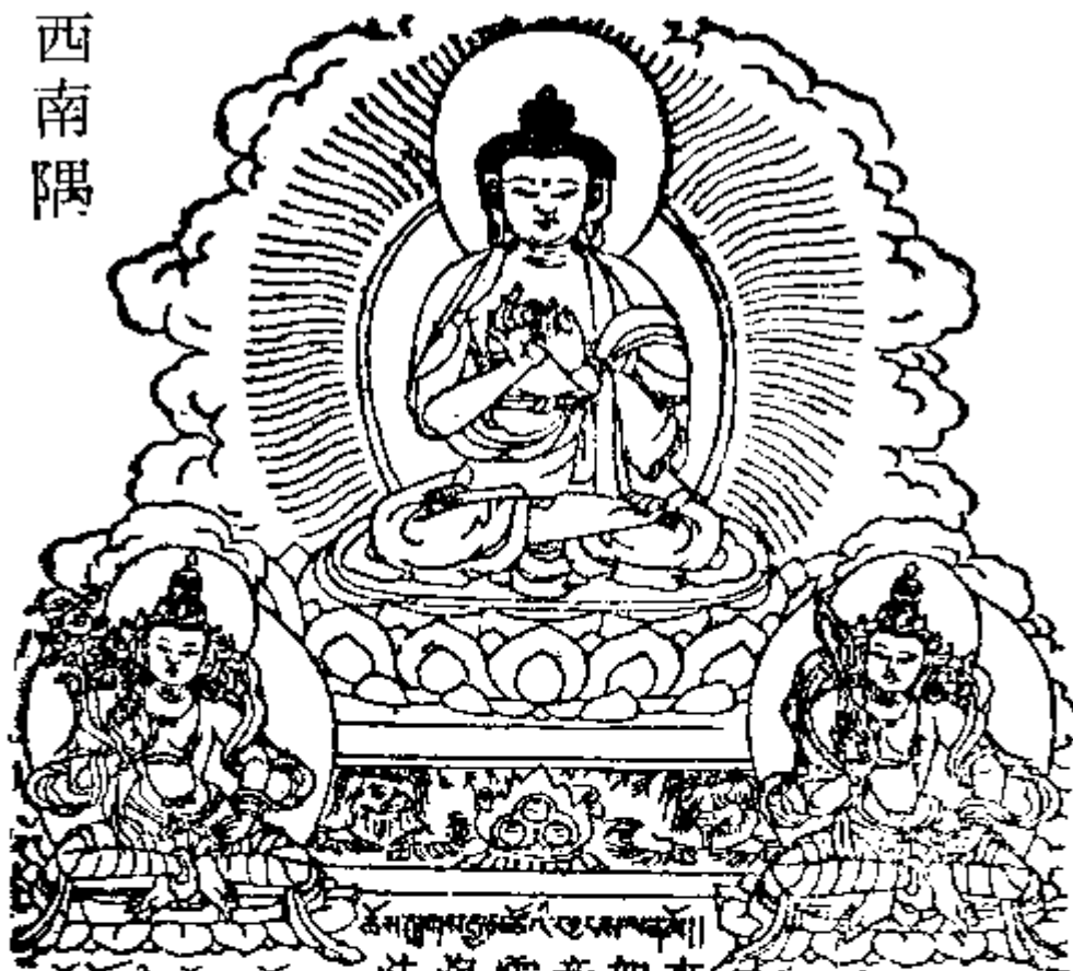
ཏཱའཛཱུའི་འཕགས་པ་ལྷོ་། 大慈菩薩