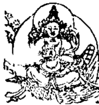
चन्द्रप्रकाशस्यै नमः 月光天子