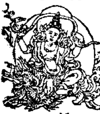
ལྷོ་ལྷོ་ལྷོ་། 水天