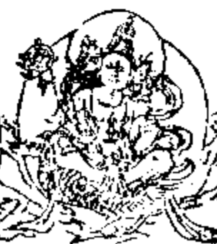
शुद्धवर्णस्यै नमः 梵天