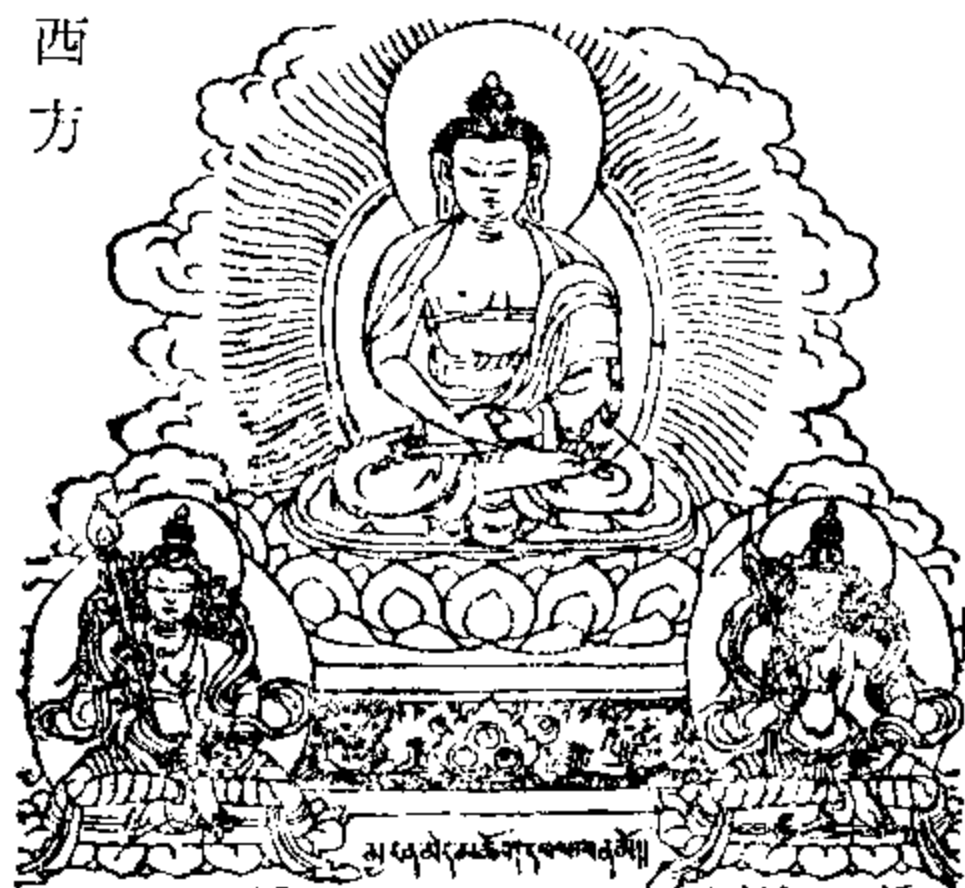
མུལ་པ་པོ་ལྷོ་ལྷོ་ལྷོ། 破冥慧菩薩