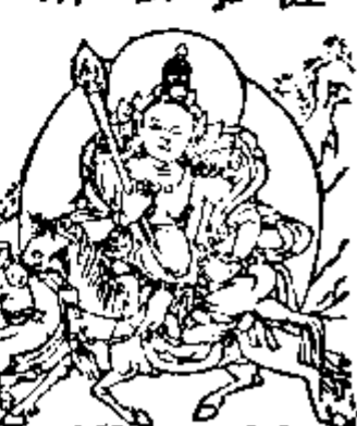
ལྷོ་ལྷོ་ལྷོ་། 藥叉天