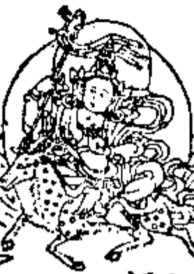
ལྷོ་ལྷོ་ལྷོ་། 風天