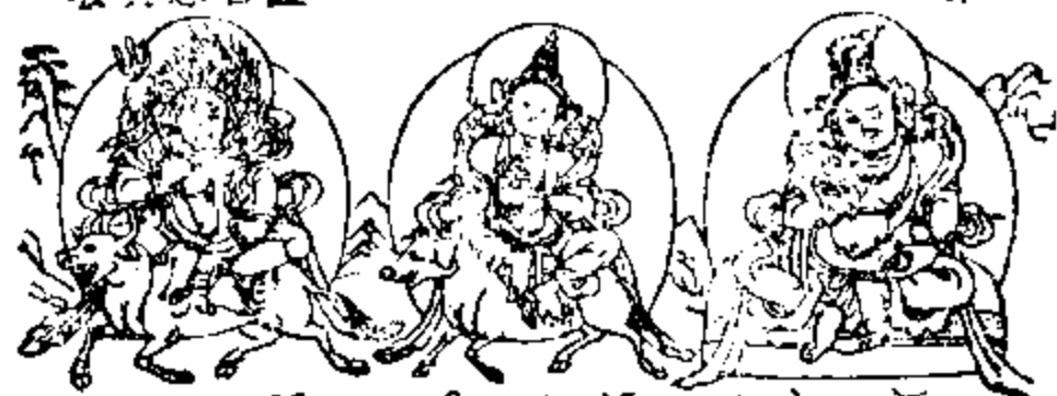
འབྲུག་ལྷོ་ལྷོ་ལྷོ། 自在天