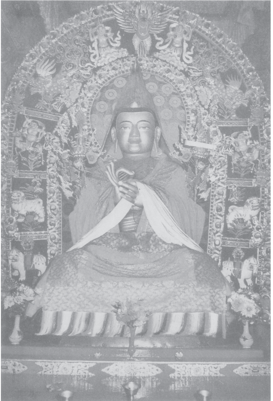
塔爾寺宗喀巴大師像