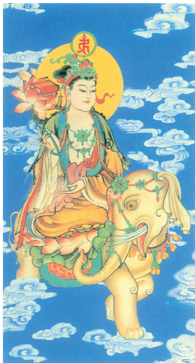
薩菩賢普行大無南