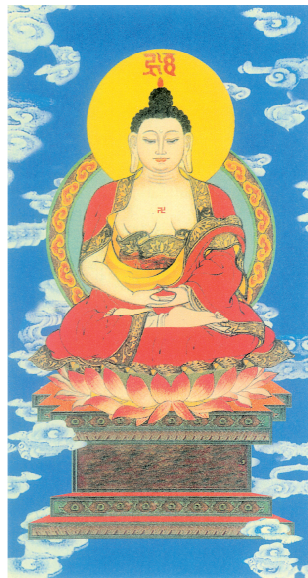
佛尼牟迦釋師本無南