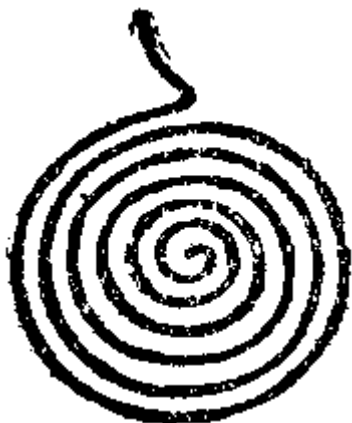
难提迦物多此云右旋。