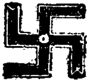
室利鞞磋此云吉祥海云。